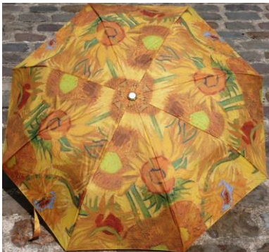
Van Gogh Tournesols