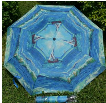
Van Gogh Paysage marin près de Saintes-Maries-de-la-Mer